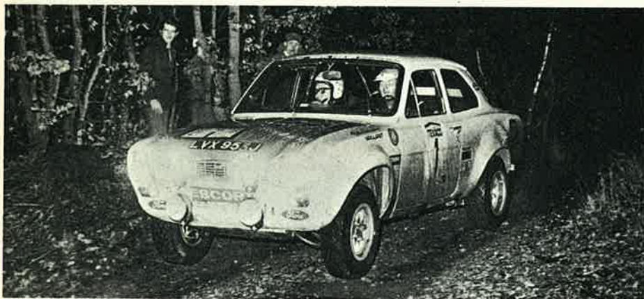
... ou le retour de Stapelaere ?

Foncer, c'est ce qu'il faudra faire dans le secteur de Liezele-Malderen. C'est peut-être là que se jouera le rallye ! C'est en tout cas un des endroits les plus durs de ce second tronçon routier : les organisateurs annoncent 6 km à faire en 6 minutes, mais en fait, il y a 8,5 km et de plus, il y a deux contrôles de sécurité et un de passage, ce qui représente encore trois arrêts. La moyenne sera