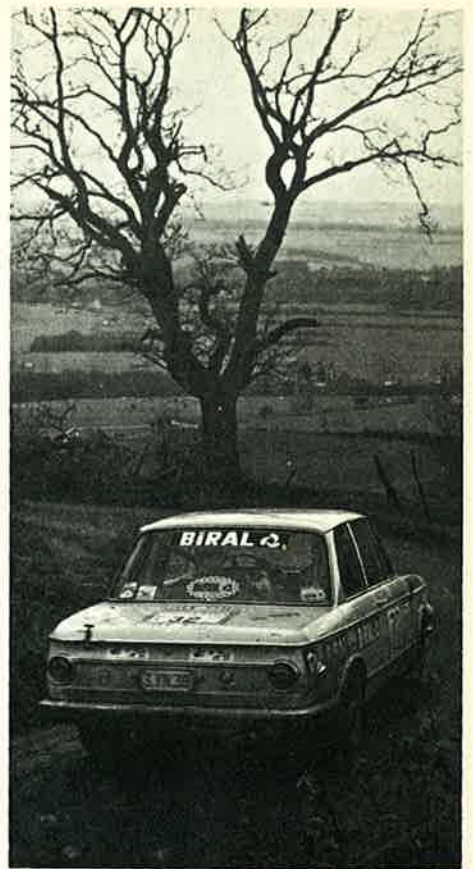
Le tour d'Adriaensens ?

Les spéciales joueront évidemment un rôle important, surtout les forestières qui permettront à certains de combler un handicap de puissance. Les circuits également, puisqu'ils permettront aux voitures puissantes de creuser l'écart, mais un